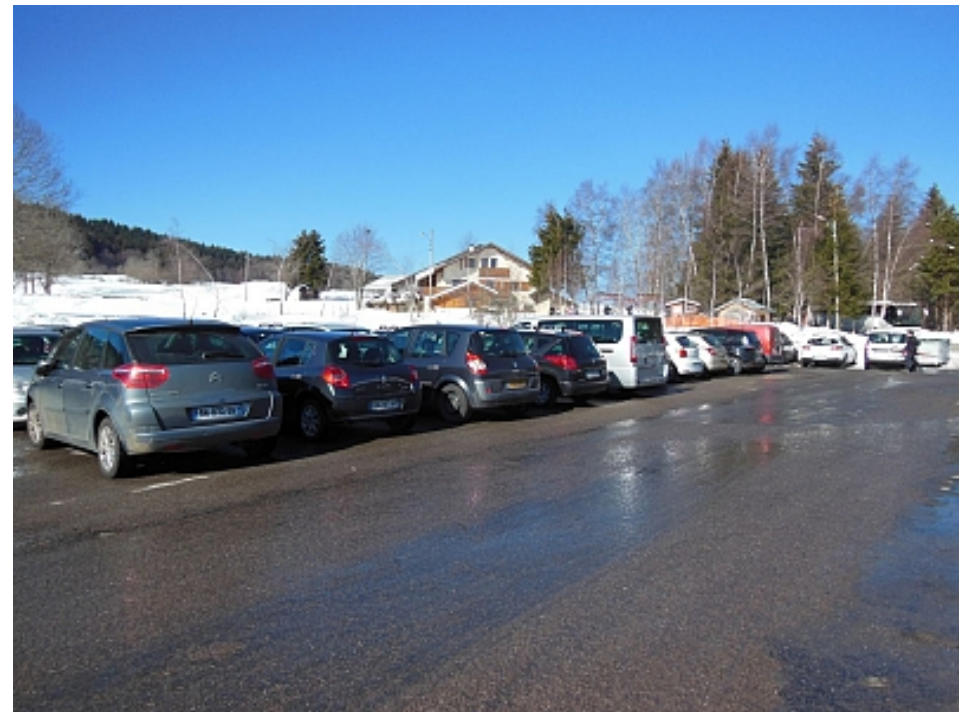
Office de Tourisme des Alpes du Léman

En hiver stationnement autorisé sauf week-ends et périodes de vacances scolaires (parking complet) Si complet aller au parking 800 m plus haut, au col du Cou, ou sur la place au coeur du village, gratuit. Se renseigner à l'office du tourisme.