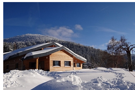
Foyer des Moises

Vous pouvez également venir vous balader sur les alentours et accéder à différents points de vue remarquables sur le Lac Léman, la Vallée Verte et même le Mont Blanc. Depuis le Foyer, installez-vous sur la terrasse pour regarder les planeurs décoller, effet garanti !