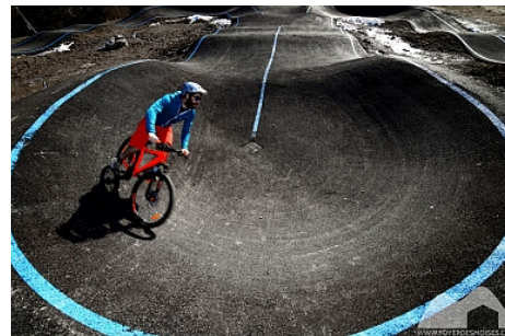
Foyer des Moises