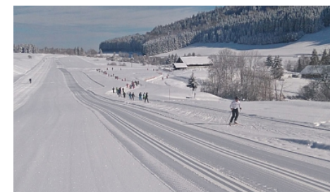
Foyer des Moises