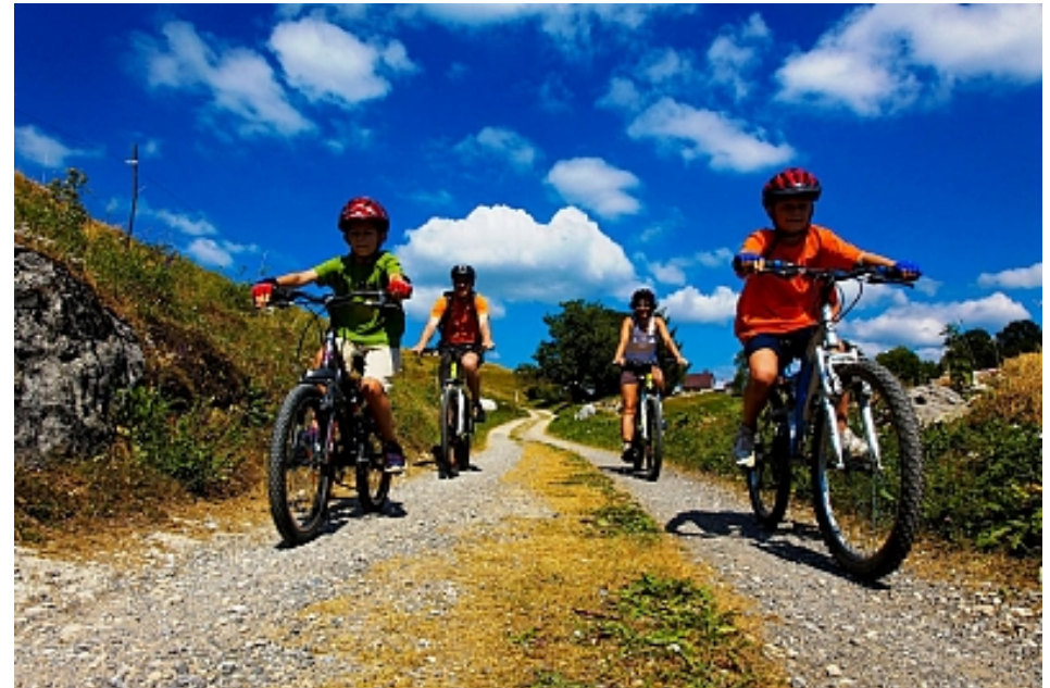
Office de Tourisme des Alpes du Léman

Accueil groupe du 01/04 au 30/10, sur réservation.