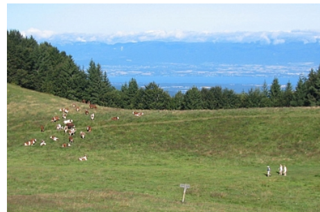
OT Val d'Hermone