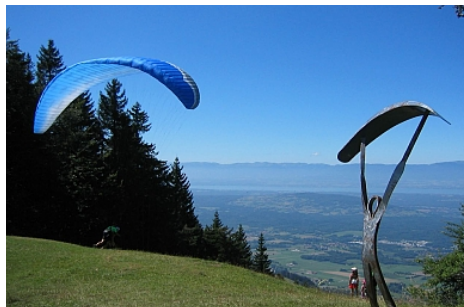
OT Val d'Hermone

L'alpage de très le Mont au départ de la randonnée vers le Mont Forchat vous offre un joli point de vue sur le lac Léman. Les vaches y paissent l'été ce qui permet de maintenir ce bel alpage. Très le Mont et le Mont Forchat forment un véritable château d'eau qui alimente une bonne partie du Bas Chablais en eau potable.