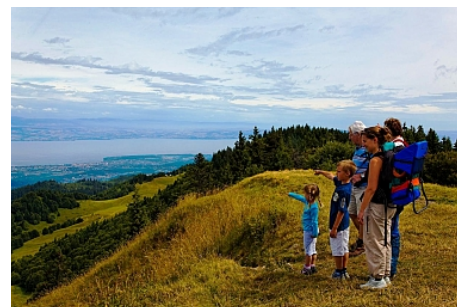
Office de Tourisme des Alpes du Léman - Gilles Place

Maintenant c'est Saint François de Sales qui veillent sur les alentours.