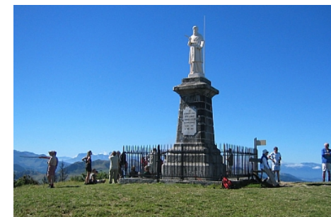
Office de Tourisme des Alpes du Léman